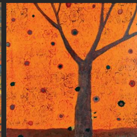
2019, akril /platno, 70 x 70 cm

je diplomiral na Akademiji za likovno umetnost v Ljubljani. Ukvarja se s slikarstvom, ilustracijo in pisanjem. Živi v Besnici pri Kranju.