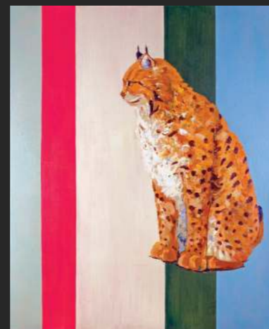
2019, olje /platno, 90 x 110 cm