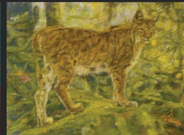
2019, olje /platno, 100 x 55 cm

je končala magistrski študij na Šoli za risanje in slikanje v Ljubljani. Ukvarja se s slikarstvom. Živi in dela v Ljubljani.