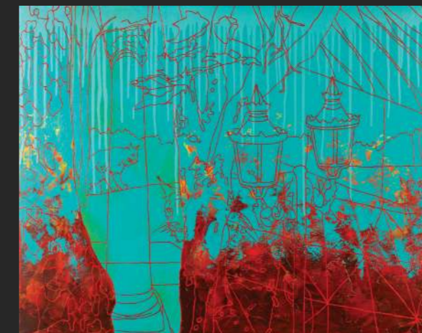
2019, olje /platno, 100 x 70 cm