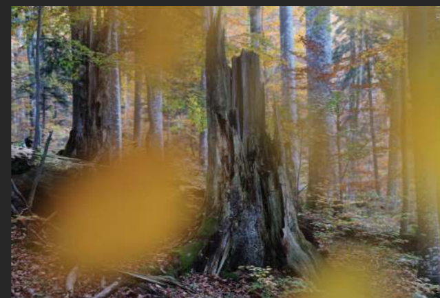
2019, barvna fotografija, 60 x 40 cm

je diplomirala na Pedagoški fakulteti v Ljubljani. Ukvarja se s slikarstvom in likovno pedagogiko. Živi v Škofji Loki.