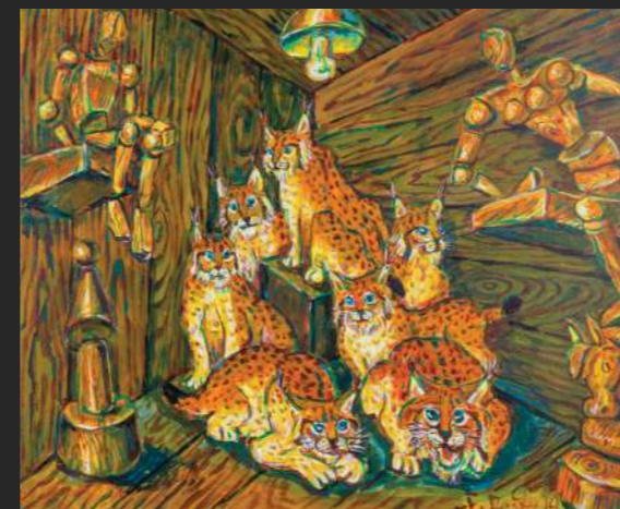
2019, akril /platno, 70 x 60 cm

je diplomirala in magistrirala na Akademiji za likovno umetnost v Ljubljani. Ukvarja se s slikarstvom, pedagoškim vodenjem, likovno kritiko in ilustracijo. Živi v Starem trgu pri Ložu.