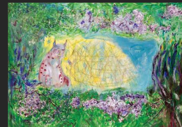
2019, mešana tehnika /platno, 120 x 80 cm

je iz slikarstva magistrirala na ljubljanski Akademiji za likovno umetnost in oblikovanje. Ukvarja se s slikarstvom in ilustracijo. Živi v Radovljici in v Loškem Potoku.