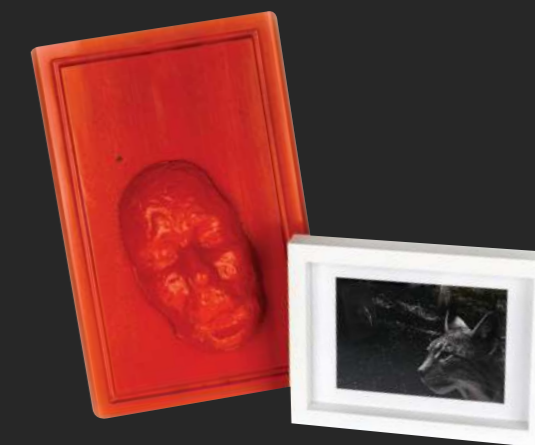
2019, mešana tehnika - objekt, 50 x 40 cm

je akademska slikarka in diplomirana literarna komparativistka. Deluje kot slikarka, likovna pedagoginja in galeristka. Živi na Lancovem pri Radovljici.